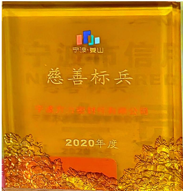
图表 7 2020 年度慈善标兵